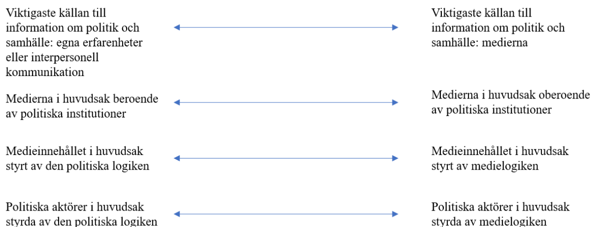
Figur 1. Den medialiserade politikens fyra dimensioner. 20

Inom medialisering finns också olika tekniker som syftar till att fånga medborgarnas uppmärksamhet genom att journalister bearbetar händelser. Dessa är även kopplade till medielogiken på så sätt att mediernas arbetssätt präglar nyhetsurvalet. Håkan Hvitfelt menar att det finns olika sätt att fånga intresset hos publiken, vidare påtalar han att det finns olika aspekter av hur formen och språket i medierna har en inverkan på mediernas innehåll. Några exempel på dessa aspekter är: (1) händelserna förenklas, (2) i ett händelseförlopp riktas intresset mot höjdpunkterna, (3) vinkling av händelsen, (4) personifiering, dvs enskilda personer används som utgångspunkt för att beskriva en händelse eller flera händelser som har en gemensam nämnare. Det som bidrar till att stärka vinklingar, höjdpunkter etc. är bilder, rubriker och ingresser. Artikelns uppbyggnad där innehåll av dramatisk och sensationell karaktär prioriteras till artikelns början är också en bidragande form av förstärkning. 21