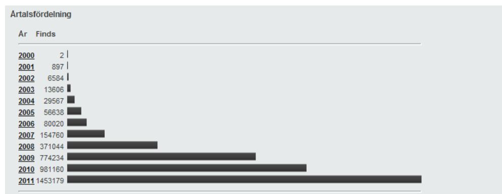
Figur 2, Visar ökningen av antalet finds från början år 2000 till 2011.

I statistik från den svenska hemsidan för geocaching går det att utläsa det kraftigt ökade intresset för fritidssysselsättningen i Sverige. På bara ett år (2010 till 2011) har antalet finds i Sverige ökat med lite drygt 500 000, vilket motsvarar en ökning med ca 48 %, se figur 2.