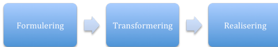
Figur 1, Läroplansteorins olika steg

Linde (2006) tar upp tre punkter som behandlar läroplansteorin: formulering, transformering och realisering av läroplanen.