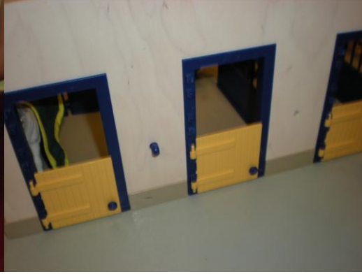
Figur (5) Häststall