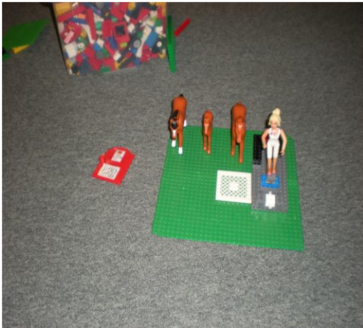
Figur(1) Sköterskan och hästfamiljen.