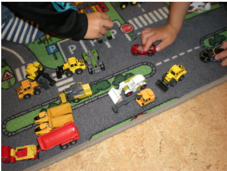
Figur (7) Två pojkar kör race med bilar