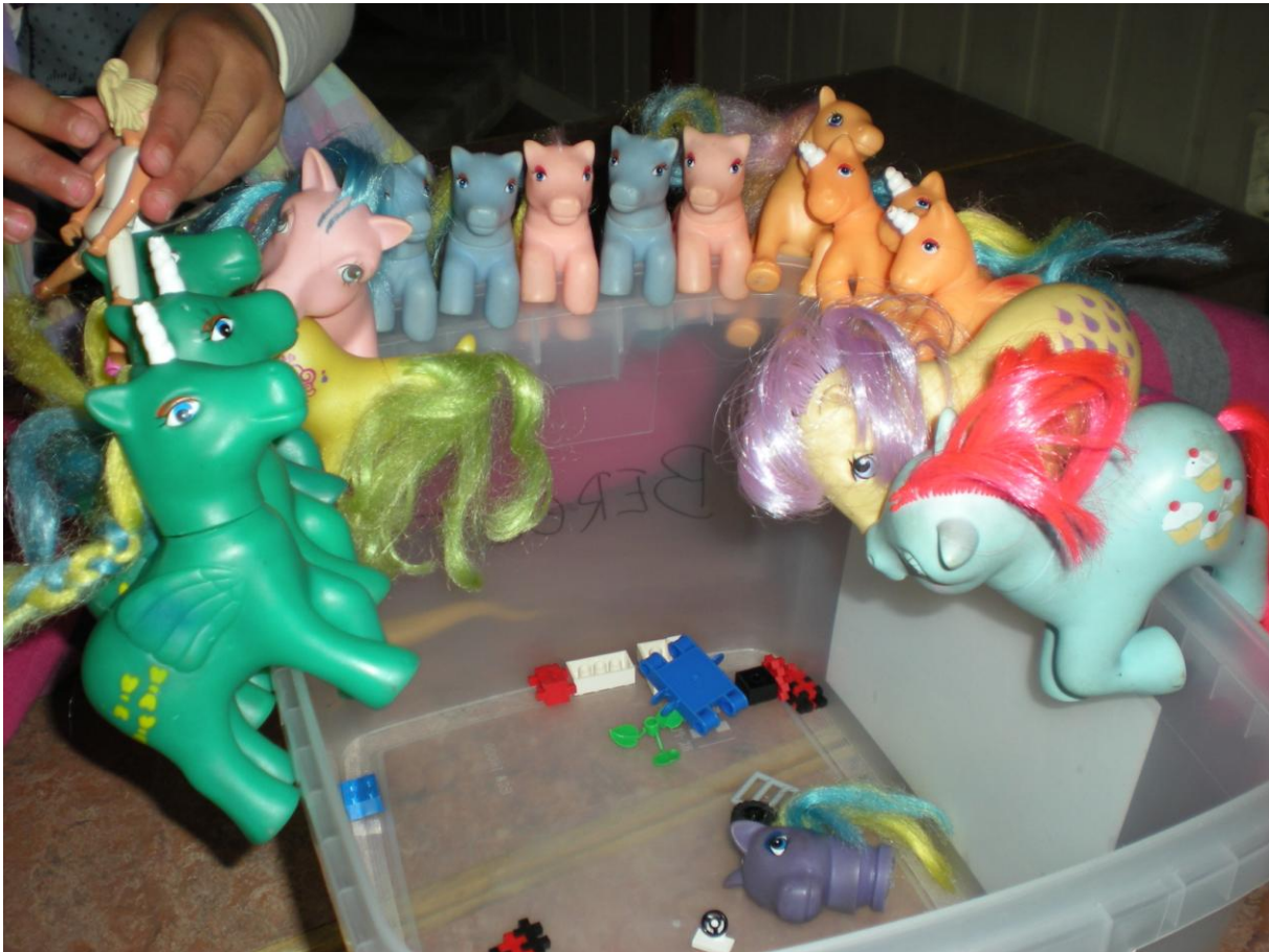
Figur (3) Hästfamiljen, pappa, mamma och "ungar", enligt barnen.