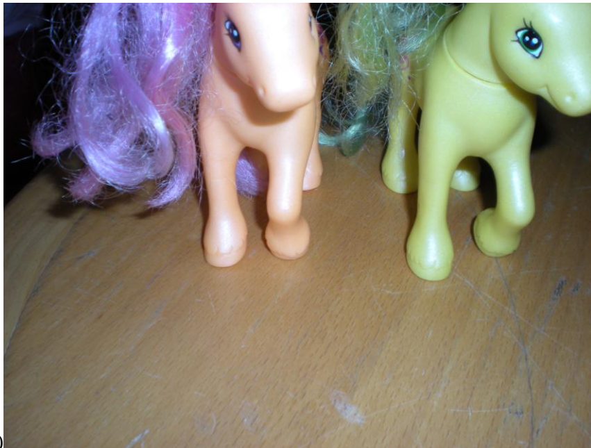
Figur(6) Pappa och mamma i hästfamiljen.