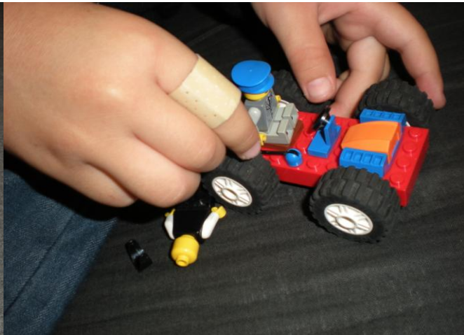
Figur(2) Gubben som kör traktör.